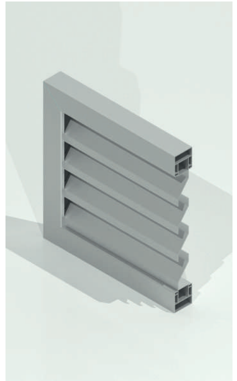
LAMA DE VENTILACIÓN