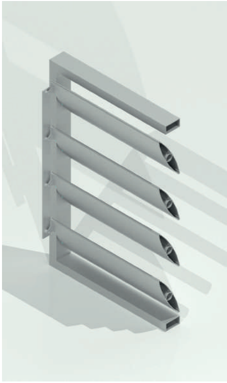
CELOSÍA MÓVIL 120